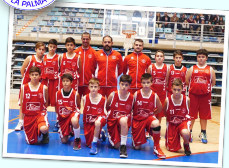
SUBCAMPEÓN: SELECTIS GRUPO INMOBILIARIO LA PALMA