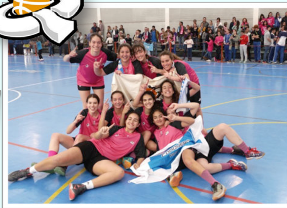
CAMPEÓN: CB CONQUERO