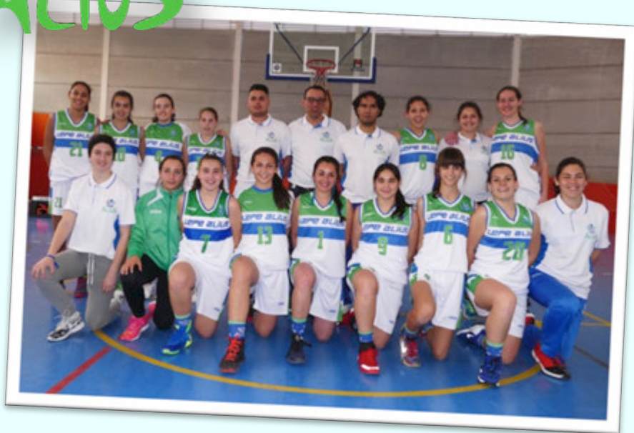
SUBCAMPEÓN: CB LEPE ALIUS