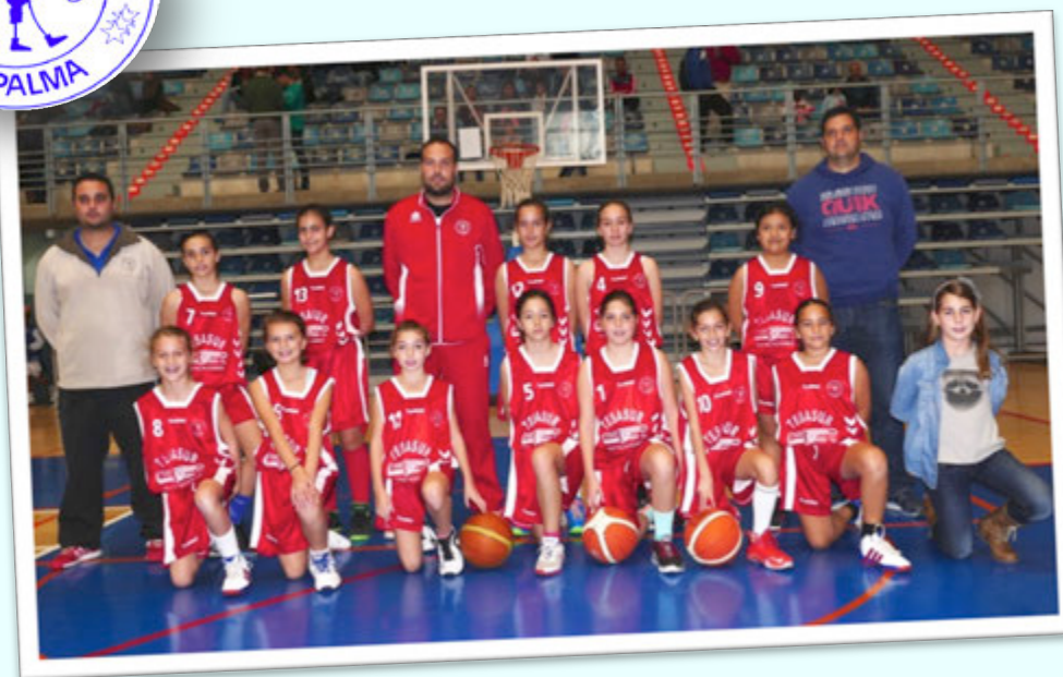
CAMPEÓN: JAMONES Y EMBUTIDOS EL SECRETO LA PALMA