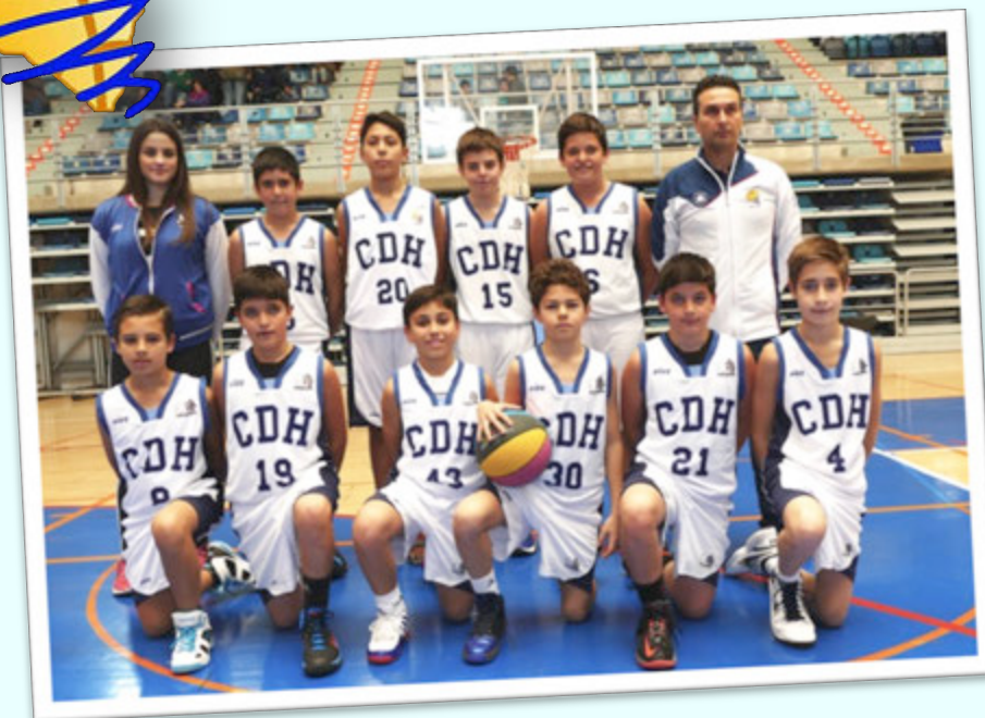
CAMPEÓN: CIUDAD DE HUELVA