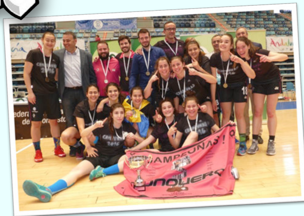
CAMPEÓN: CB CONQUERO JR