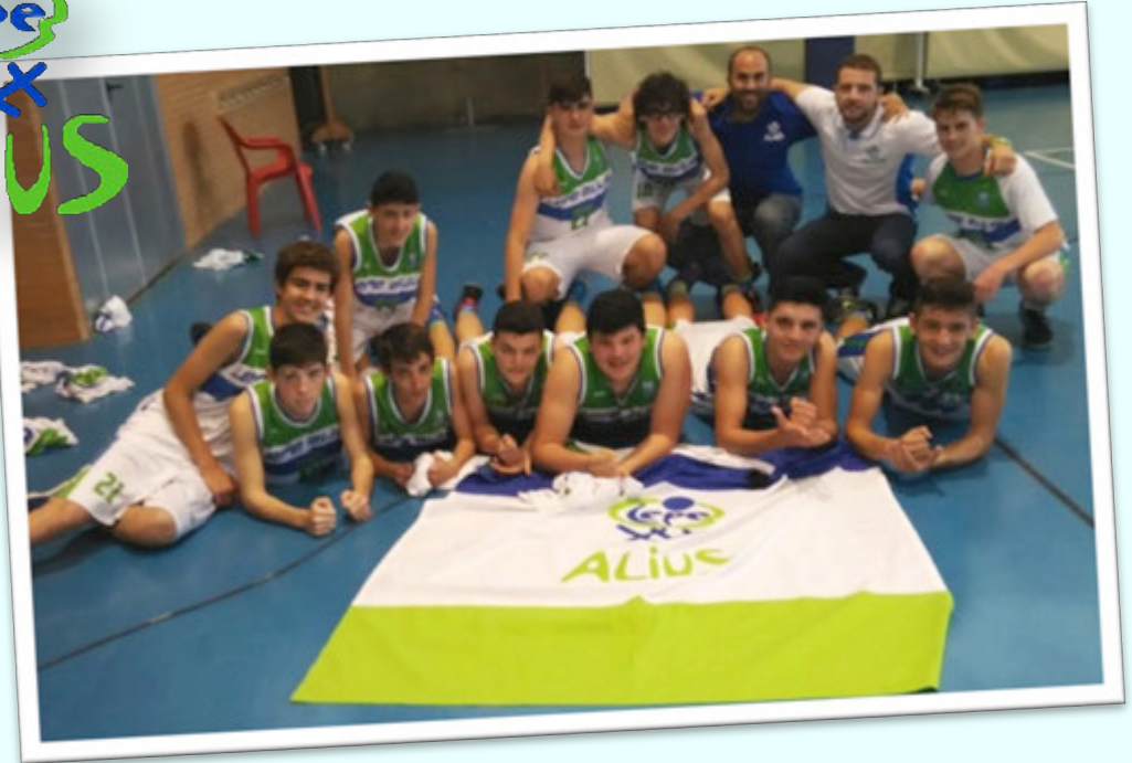
CAMPEÓN: CB LEPE 2001