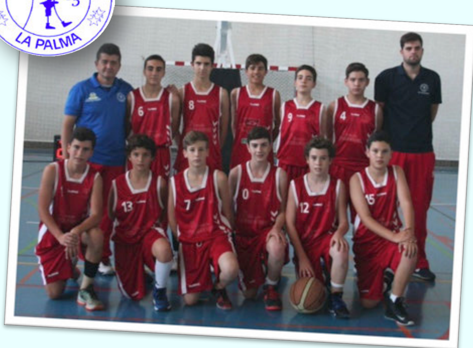
SUBCAMPEÓN: ISSER SERIGRAFÍA LA PALMA