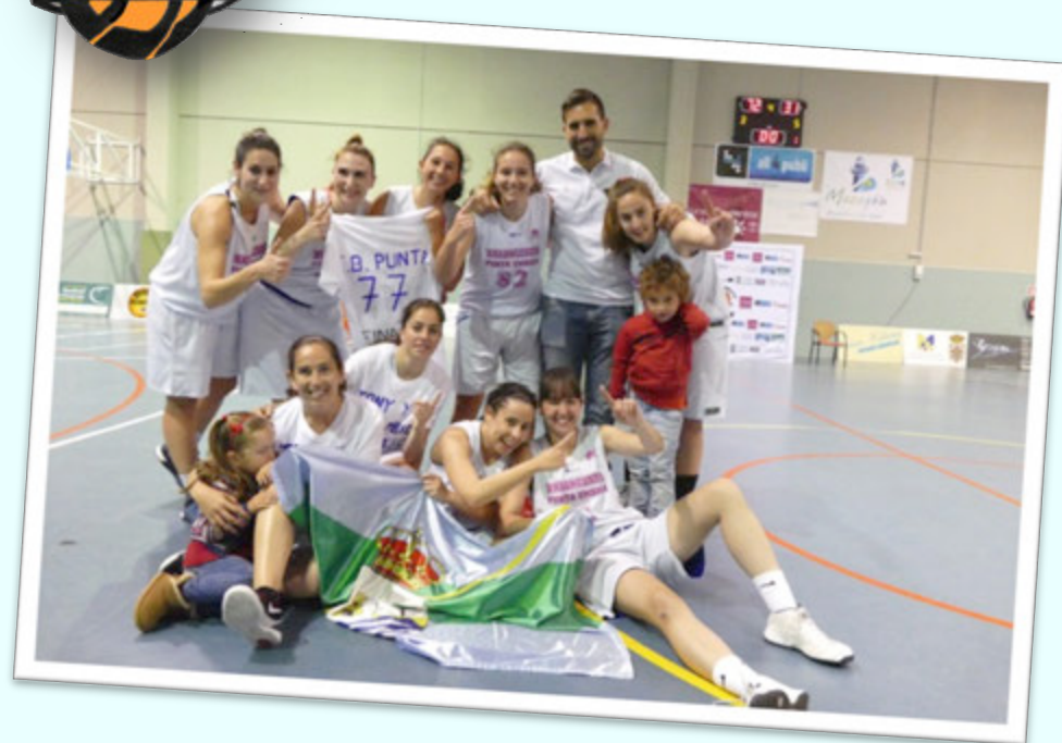
SUBCAMPEÓN: CB PUNTA