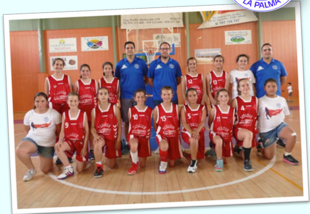
CAMPEÓN: JAMONES Y EMBUTIDOS EL SECRETO LA PALMA