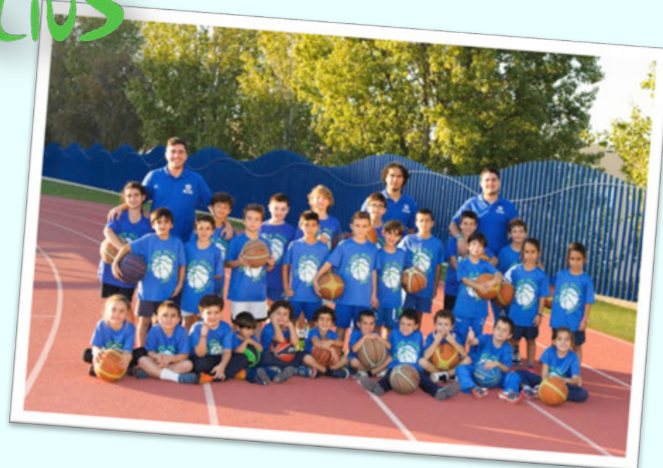
CAMPEÓN: CB LEPE ALIU$