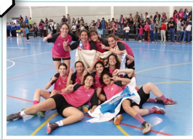
CAMPEÓN: CB CONQUERO