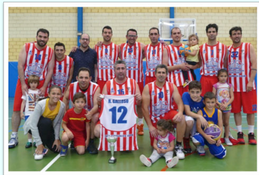
CAMPEÓN: VIEJUNOS CLUB