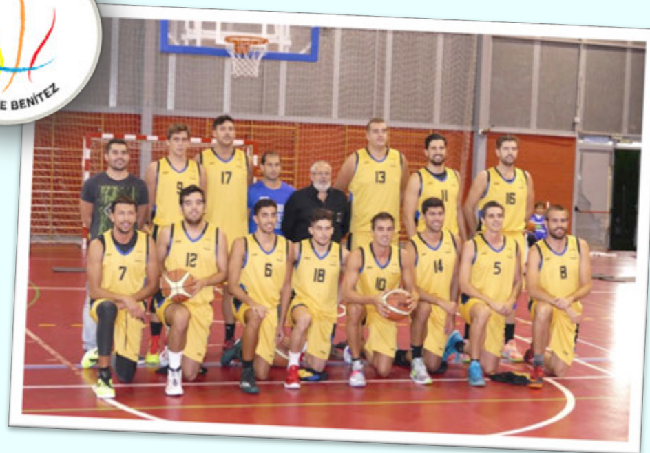
CAMPEÓN: HUELVA (CDB Enrique