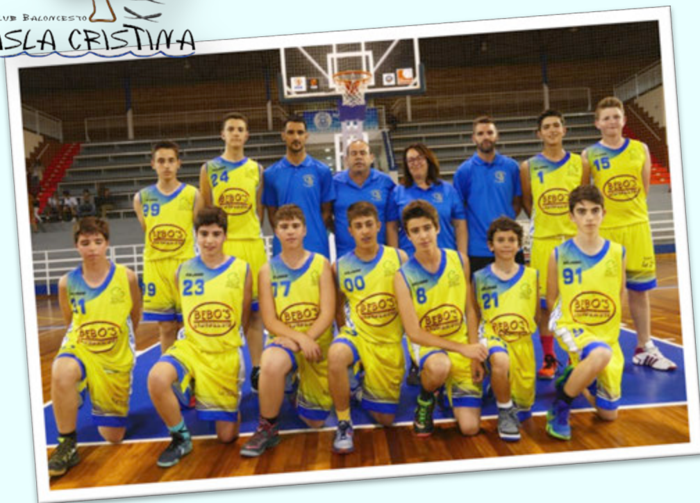
SUBCAMPEÓN: CB ISLA CRISTINA