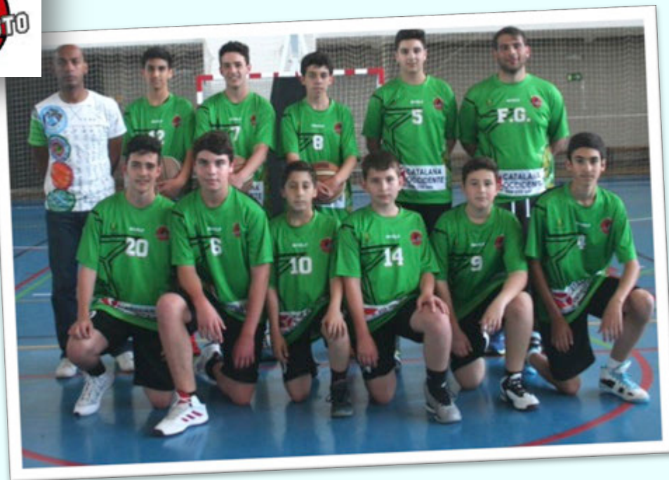
CAMPEÓN: FERRER AYAMONTE BALONCESTO