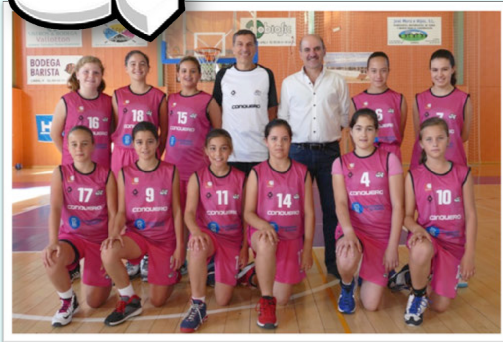
SUBCAMPEÓN: C.B. CONQUERO