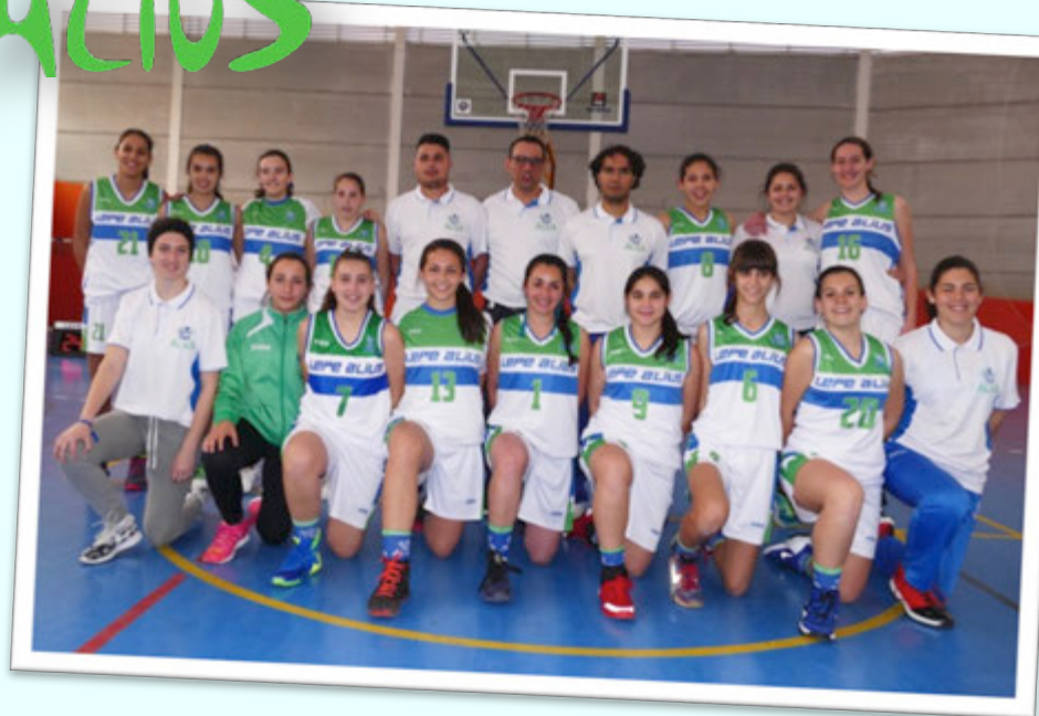
SUBCAMPEÓN: CB LEPE ALIUS