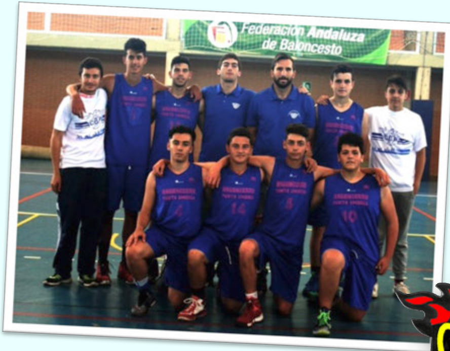
SUBCAMPEÓN: SMD PUNTA