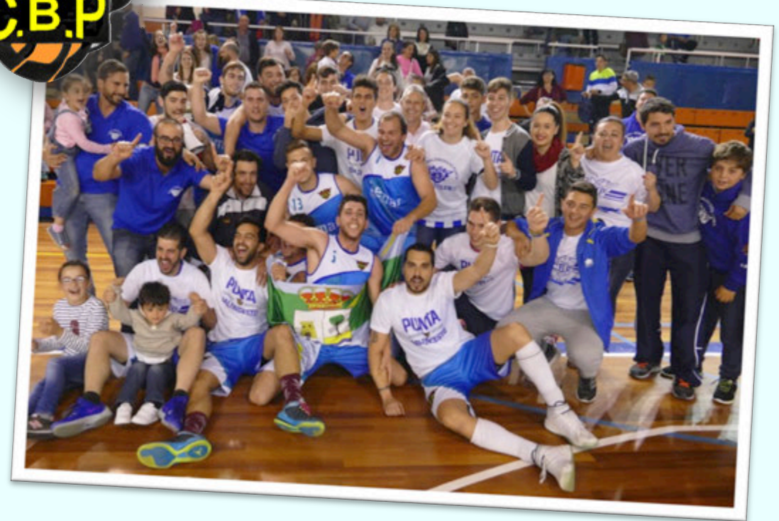
CAMPEÓN: CB PUNTA