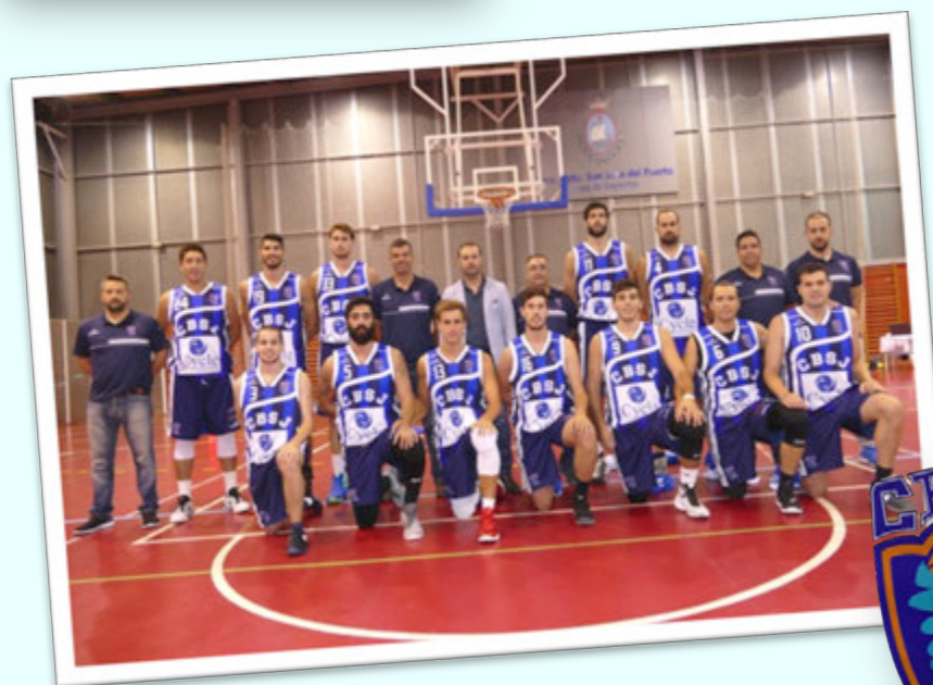
SUBCAMPEÓN: CYCLE CB SAN