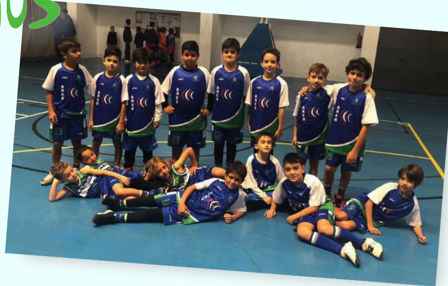
CB LEPE ALIUS ÁREA DE SERVICIO INTEGRAL