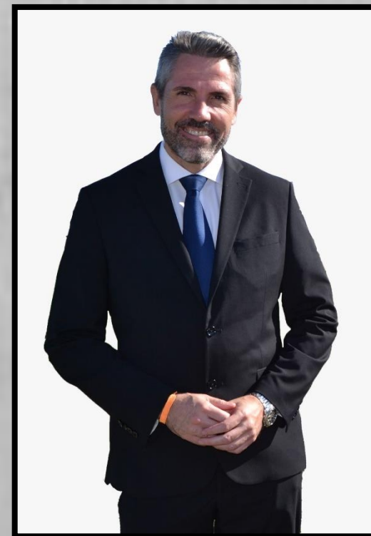
José Ángel Nozal Lajo, Alcalde de Mijas (Málaga)