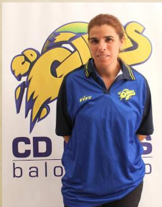
INMA PÉREZ JÚNIOR FEMENINO

Pero cada edad/categoría tiene su historia y los entrenadores tienen que conocerlas. No se trata de ser más o menos serios en el trabajo, pero hay que dar confianza a las jugadoras y ser sensibles a su época académica. Cada jugadora es también estudiante y persona que tienen muchos objetivos... unos deportivos, otros académicos, otros profesionales.. que no pueden estar enfrentados. Se trata de equilibrar, que ellas vean que la categoría junior es el paso previo para seguir disfrutando del Baloncesto en Senior. Que cuando cumplan 18 años y tengan algunos de sus sueños académicos cumplidos puedan seguir disfrutando con sus compañeras porque "no dejaron del todo el baloncesto".