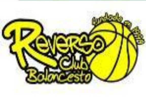
HOSPITAL VIAMED EL REVERSO C.B.