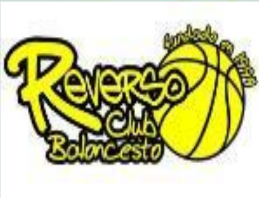
HOSPITAL VIAMED EL REVERSO C.B.