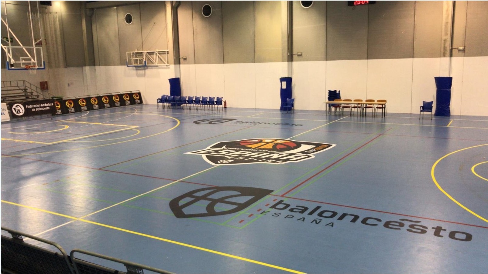
Polideportivo Antonio Gil Hernández Andévalo, 2 - 21100 Punta Umbría (Huelva)