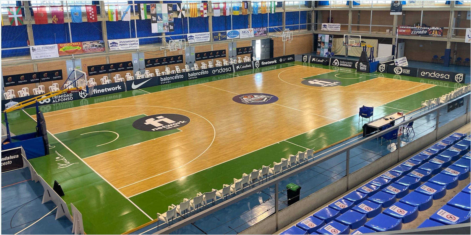
Complejo Deportivo Alcalde José Hernández Albarracín Poeta Miguel Hernández, 3 - 21100 Punta Umbría (Huelva)