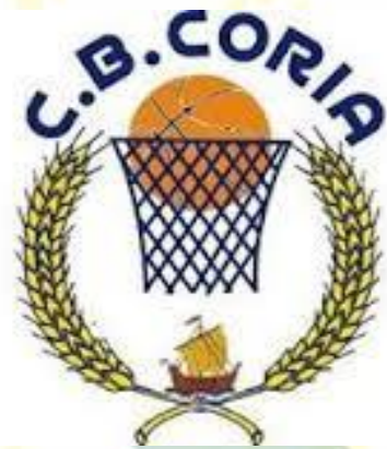
CLUB BALONCESTO CORIA