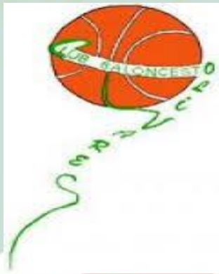
CLUB BALONCESTO OLIVARES