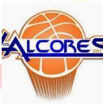
C.B. LOS ALCORES U.P VISO