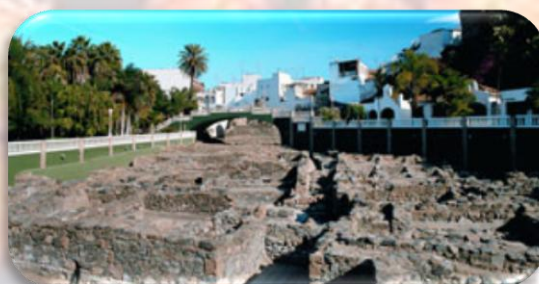
Factoría Salazón de Pescado " El Majuelo "