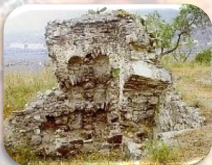
Columbario la Albina