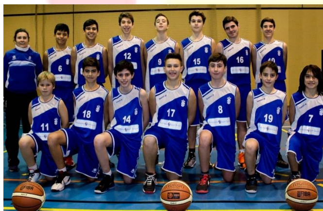
ÉCIJA BASKET CLUB