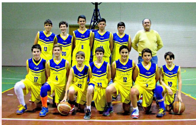
CLUB BALONCESTO CORIA