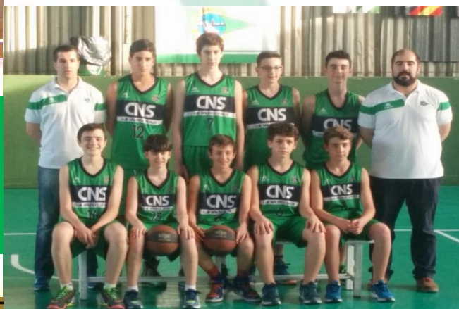
C.D. TOMARES ALJARAFE XXI