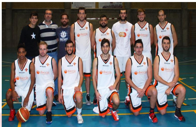
CLUB BALONCESTO LOS ALCORES