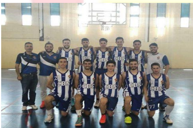
C.B 20 DE COPAS MARCHENA