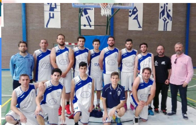
CLUB BALONCESTO SANTIPONCE