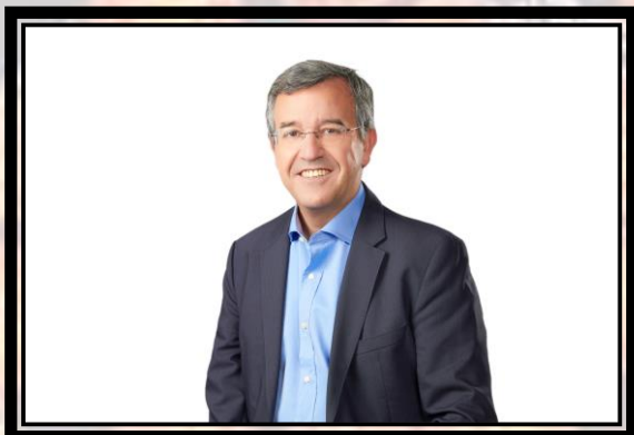
José María García Urbano, Alcalde de Estepona.

Estepona ha demostrado que es una ciudad que facilita a los ciudadanos la práctica de todo tipo de disciplinas deportivas. Desde el Ayuntamiento de Estepona y las diferentes escuelas y clubes deportivos se trabaja durante todo el año para que los niños incorporen la práctica del deporte a sus vidas desde edades tempranas. Todo ello, con el convencimiento de la importancia de fomentar hábitos saludables y valores como el compañerismo, el esfuerzo y el trabajo en equipo.