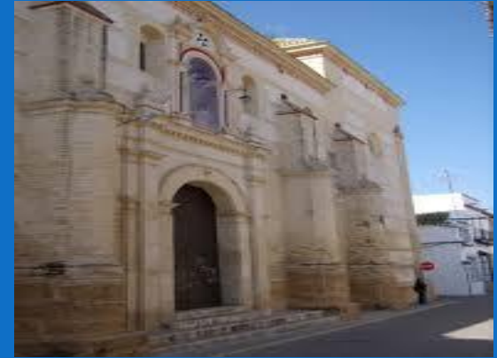
CONVENTO Nª Sª DEL ROSARIO