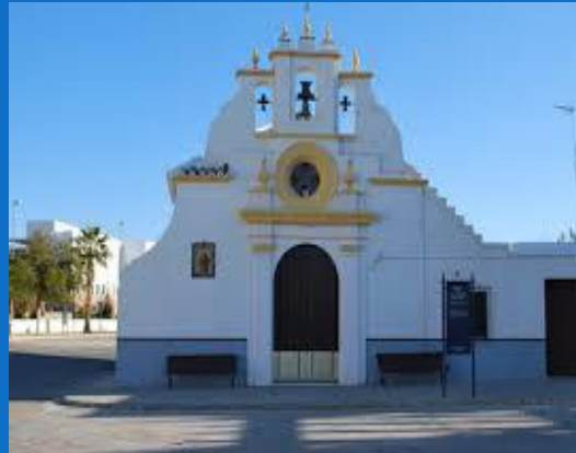
ERMITA DE SAN ANTONIO