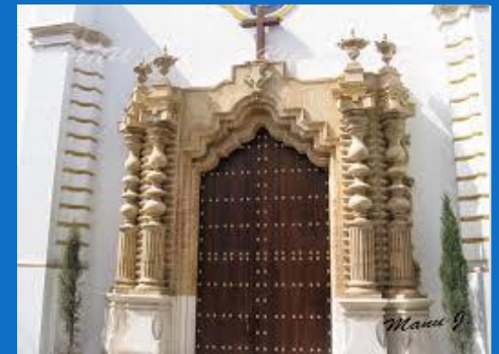
CAPILLA DE LA VERACRUZ