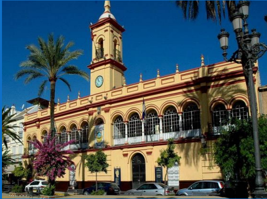
AYUNTAMIENTO DE ARAHAL