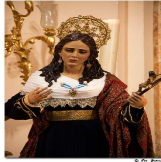
SANTA MARIA MAGDALENA