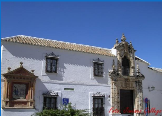
PALACIO DE LOS MARQUESES DE LA PEÑA