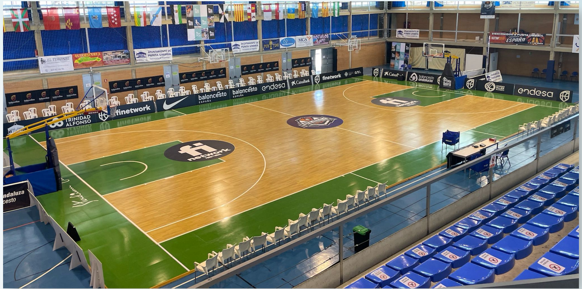
Complejo Deportivo Alcalde José Hernández Albarracín Poeta Miguel Hernández, 3 - 21100 Punta Umbría (Huelva)