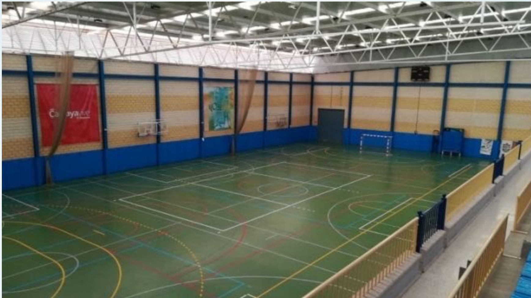
Pabellón Alcalde Juan Miguel Polo Plana Carretera de El Rompido, Km. 1 - 21450 - Cartaya (Huelva)