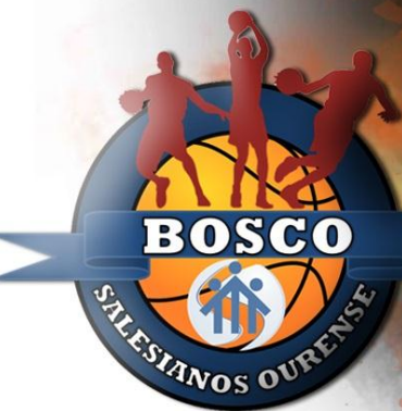
Bosco Salesianos Ourense

Cadete femenino en los pabellones de Las Gabias e Hjar, Granada 18 AL 20 DE MARZO