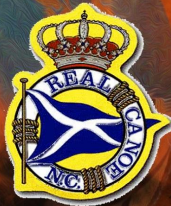
Real Canoé Madrid