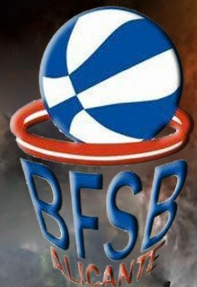
San Blás Alicante