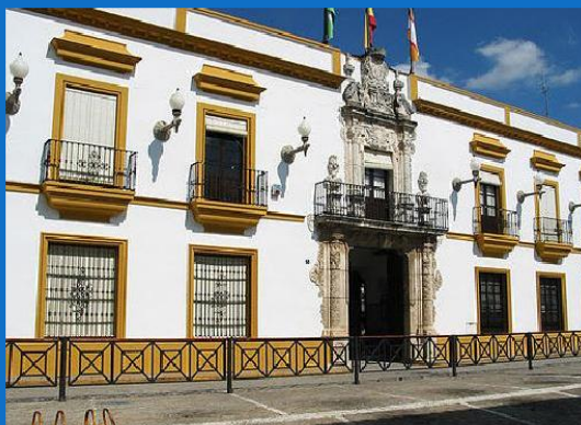
EXCMO. AYUNTAMIENTO UTRERA