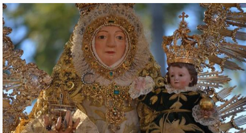
Ma STMA. DE CONSOLACIÓN