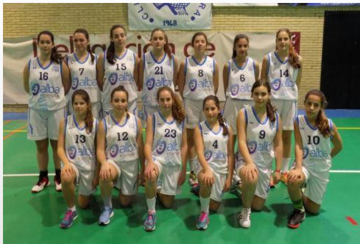
ALBA IBS C.B. UTRERA