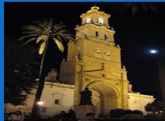
IGLESIA STA. MARÍA DE LA MESA