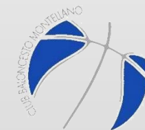
C.D. MONTELLANO E.D.M