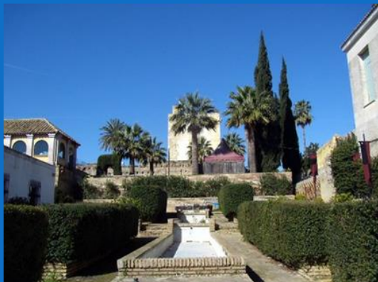
CASTILLO ÁRABE DE UTRERA