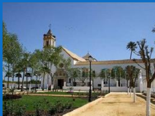
SANTUARIO DE CONSOLACIÓN