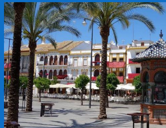
PLAZA DEL ALTOZANO