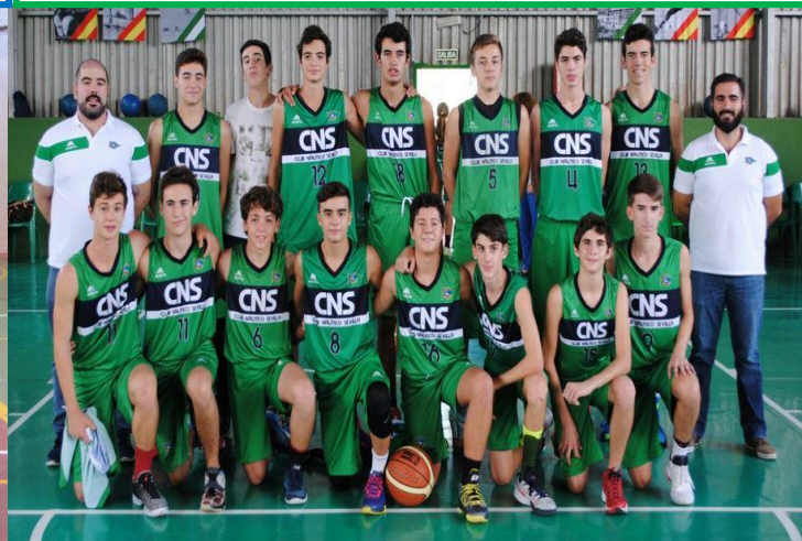
CLUB NÁUTICO SEVILLA