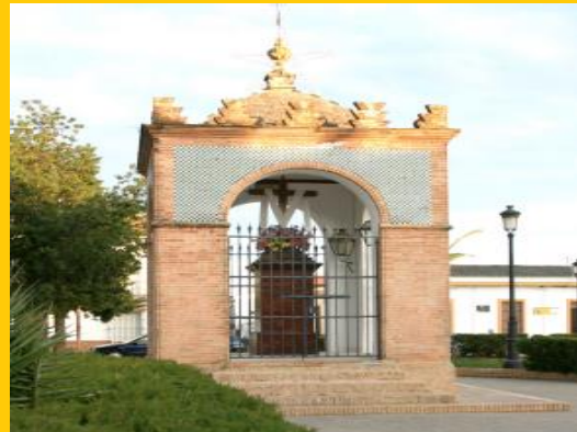
Sta. Cruz HUMILLADERO