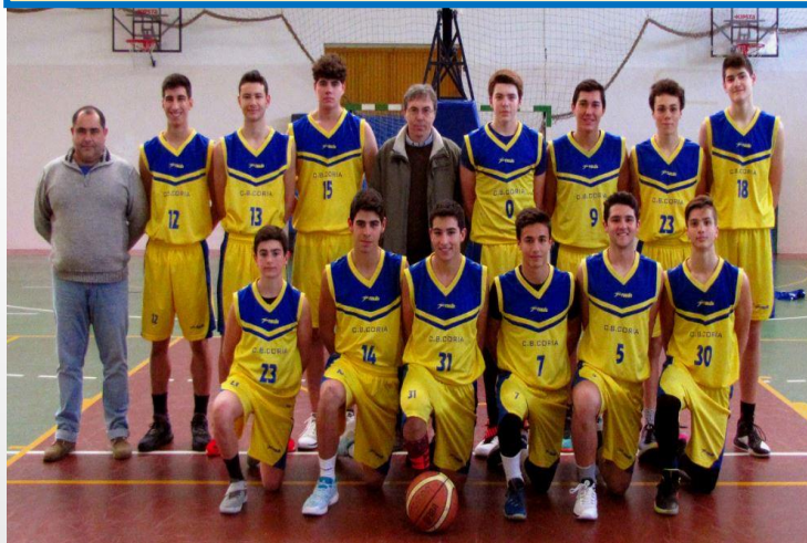
CLUB BALONCESTO CORIA XL