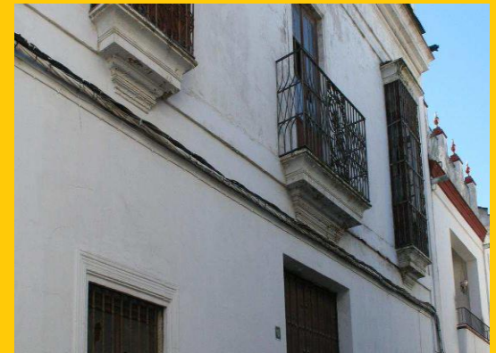
CASA JUAN DE LA ROSA