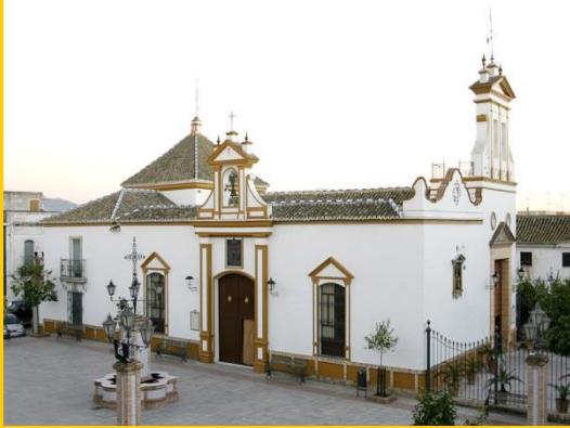
HERMITA Nª Sª de BELEN