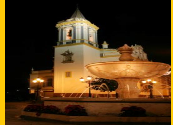
IGLESIA SANTA MARIA