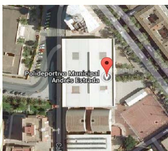
Pdvo. Andrés Estrada Avd. Pio XII s/n Tlf.- 959 221 001