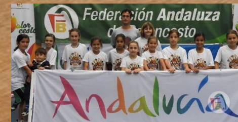
ALSARA CORDOBASKET CAMPEÓN PREMINIBASKET FEMENINO