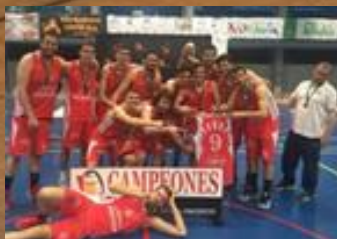
INNOVASUR MARISTAS CORDOBA 75 CAMPEÓN SENIOR MASCULINO