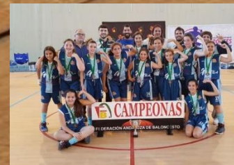
ADEBA 2006 CAMPEÓN MINIBASKET FEMENINO