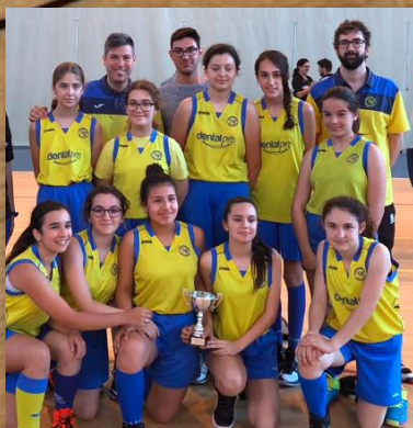
C.D. DECORSENECA CAMPEÓN INFANTIL FEMENINO