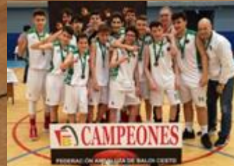
HOTEL LOS NARANJOS CORDOBASKET CAMPEÓN INFANTIL MASCULINO