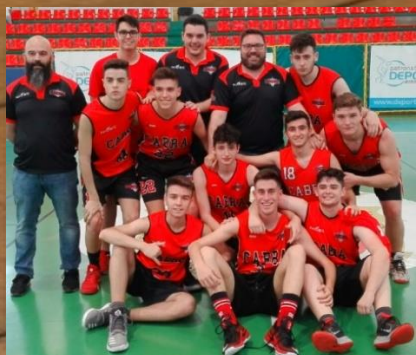
AUTOESCUELA JULIO CDB CABRA CAMPEÓN JUNIOR MASCULINO