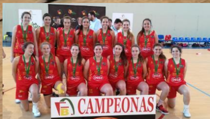
DEZA MARISTAS CORDOBA 75 CAMPEÓN CADETE FEMENINO