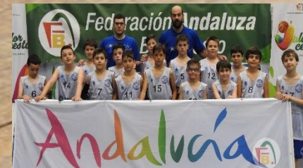
VIDRIMON MONTILLA CAMPEÓN PREMINIBASKET MASCULINO