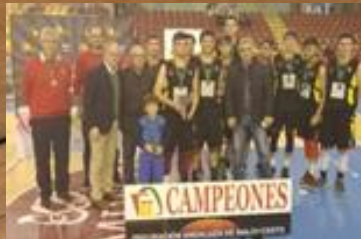
MULTIOPTICAS ANTOU PEÑARROYA CAMPEÓN JUNIOR MASCULINO