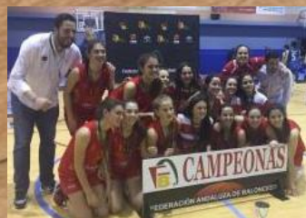
DEZA MARISTAS CORDOBA 75 CAMPEÓN JUNIOR FEMENINO