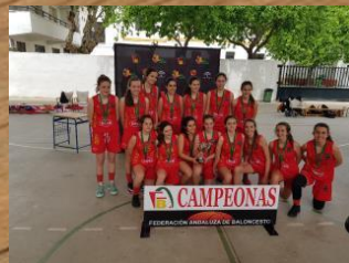
DEZA MARISTAS A CORDOBA 75 CAMPEÓN INFANTIL FEMENINO