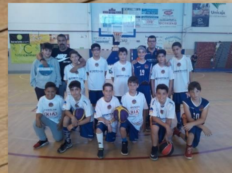
PENIBETICA DEL SUR '06 CIUDAD CORDOBA CAMPEÓN MINIBASKET MASCULINO