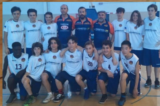
PENIBETICA DEL SUR '04 CIUDAD CORDOBA CAMPEÓN INFANTIL MASCULINO