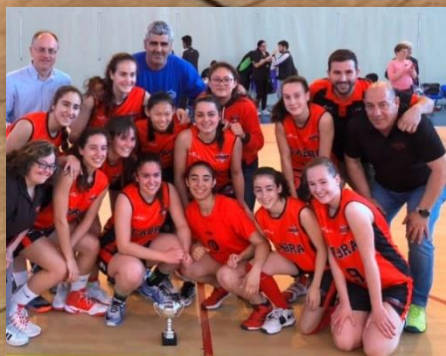
FUNDACION PROMI- CDB CABRA CAMPEÓN CADETE FEMENINO