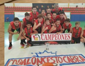
BAR JULI GDB CABRA CAMPEÓN MINIBASKET MASCULINO