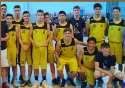
COLEGIO VIRGEN DEL CARMEN A CAMPEÓN CADETE MASCULINO