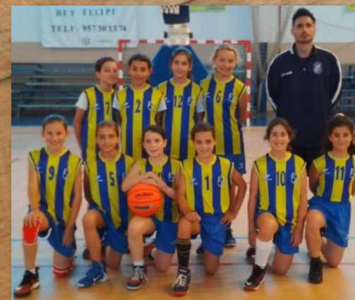
C.B. LA SALLE CAMPEÓN MINIBASKET FEMENINO