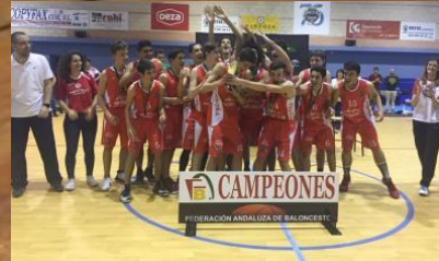
MARISTAS GÓRDOBA A 75 CAMPEÓN CADETE MASCULINO