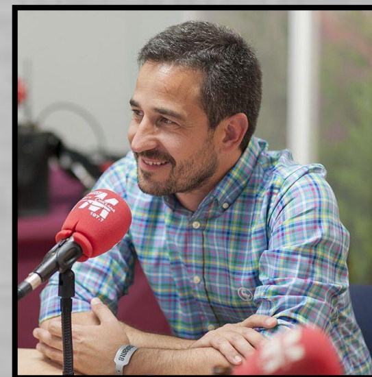
José Manuel Vera, Concejal de Deportes de Chiclana