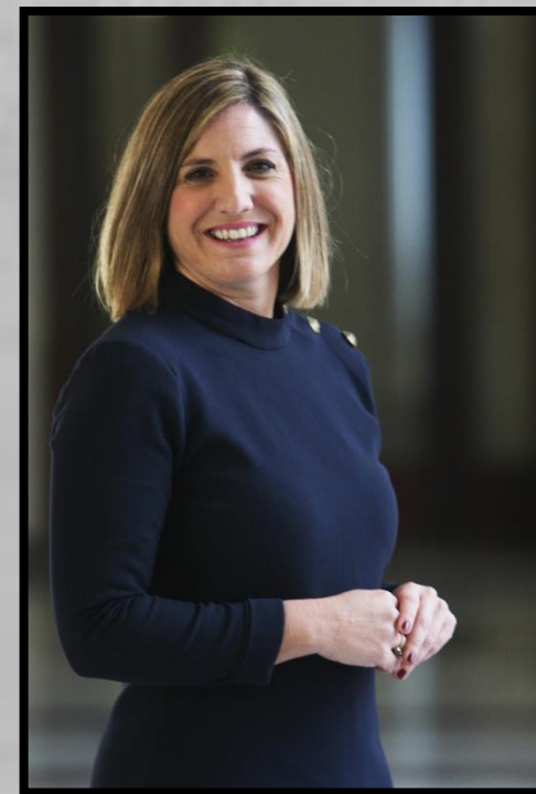
Irene García Macías, Presidenta de la Diputación Provincial de Cádiz

Chiclana es un ejemplo del trabajo que se viene realizando desde nuestros ayuntamientos por poner a la provincia de Cádiz en el escaparate del deporte andaluz y nacional. Vivamos este Campeonato de Andalucía de Baloncesto de Selecciones Cadete Masculinas con entusiasmo, con alegría y dando la mejor acogida a los participantes, a sus familias, a los aficionados en general. En Chiclana, en la provincia de Cádiz, sabemos hacerlo.