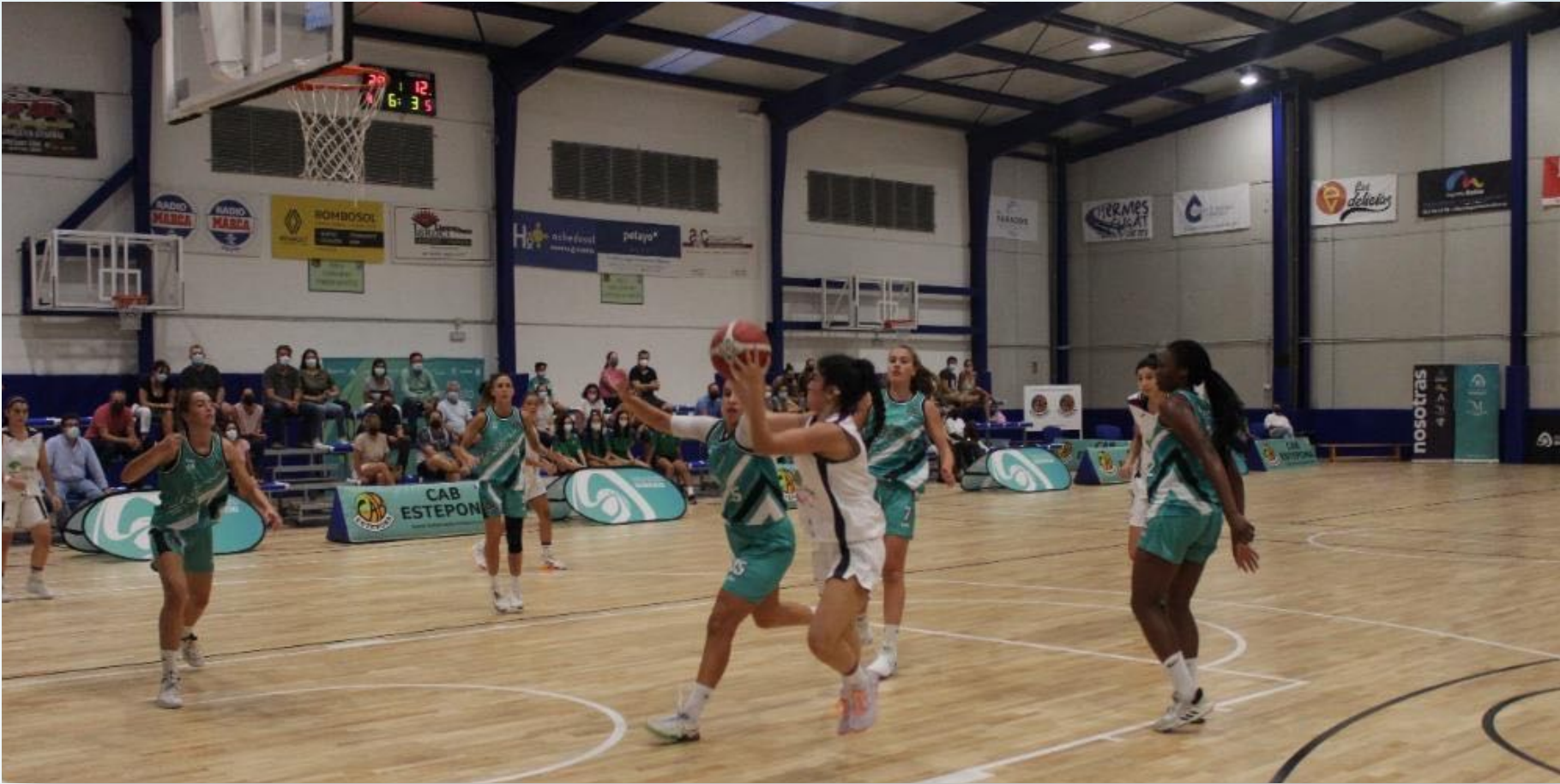
Pabellón Municipal José Antonio Pineda Cristóbal Ruiz Méndez, 29 - 29680 Estepona (Málaga)