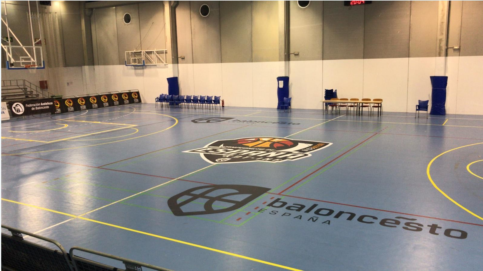
Polideportivo Antonio Gil Hernández Andévalo, 2 - 21100 Punta Umbría (Huelva)