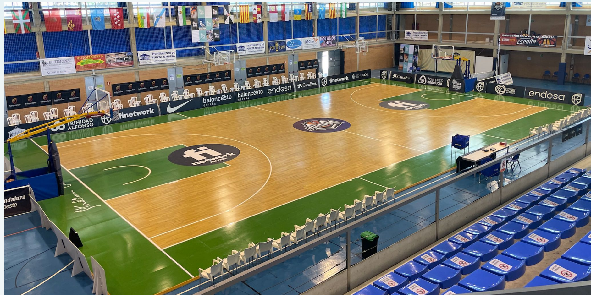
Complejo Deportivo Alcalde José Hernández Albarracín Poeta Miguel Hernández, 3 - 21100 Punta Umbría (Huelva)