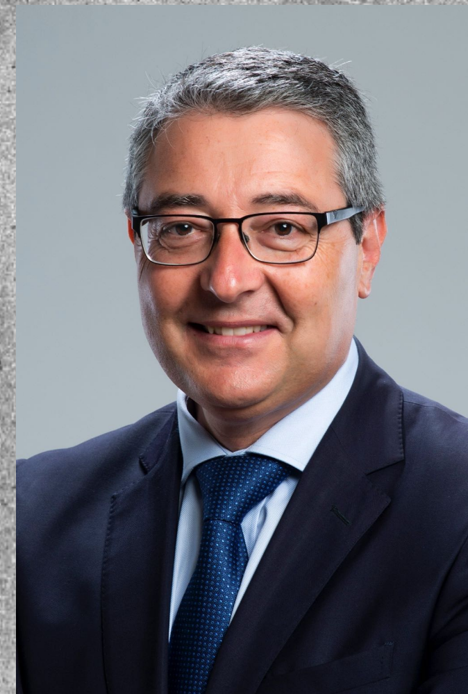
Francisco Salado , Presidente de la Diputación de Málaga

Por eso felicitamos a los organizadores y damos la enhorabuena por adelantado a los más de 150 jugadores que estarán en el nuevo pabellón de la Ciudad Deportiva de Sabinillas, donde los amantes del baloncesto tienen una cita ineludible este mes de enero.