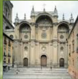
Catedral de Granada