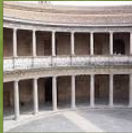
Palacio de Carlos V