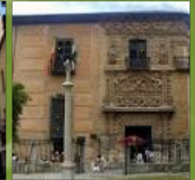
Museo Arqueológico y Etnológico de Gr...