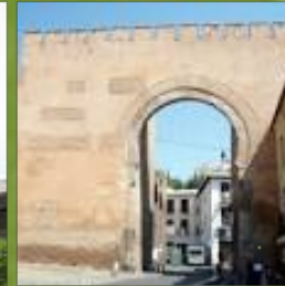
Puerta de Elvira