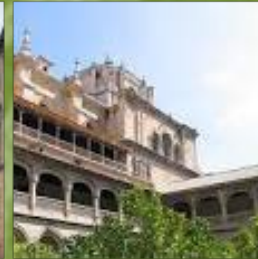
Monasterio de San Jerónimo