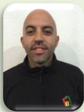
1º ENTRENADOR FAB:

"Estamos preparados para SUFRIR, para COMPETIR y para DISFRUTAR de todo ello cada segundo"