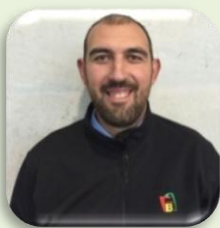
1º ENTRENADOR FAB:

“Estamos deseando que llegue el día 3 a las 19:30 horas para dejarnos el alma en cada segundo del campeonato”