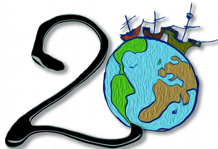
Aniversario del Muelle de las Carabelas