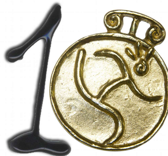
Aniversario del Campeonato Iberoamericano de Atletismo