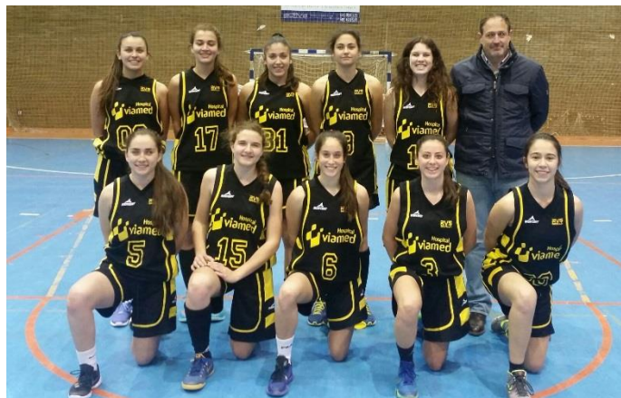
HOSPITAL VIAMED EL REVERSO C.B.