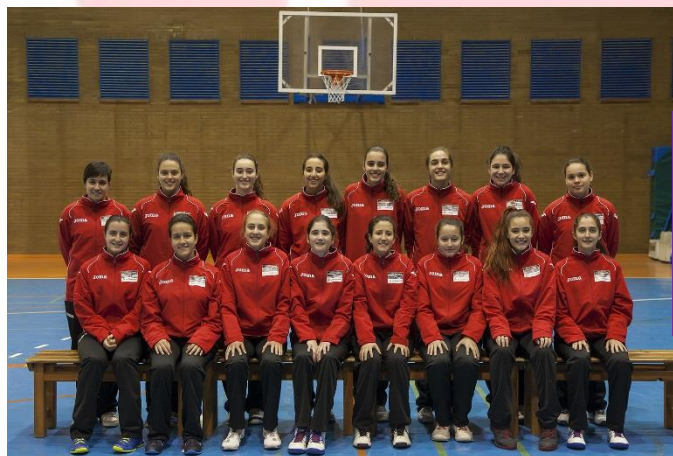
CLUB BASKET NAZARENO