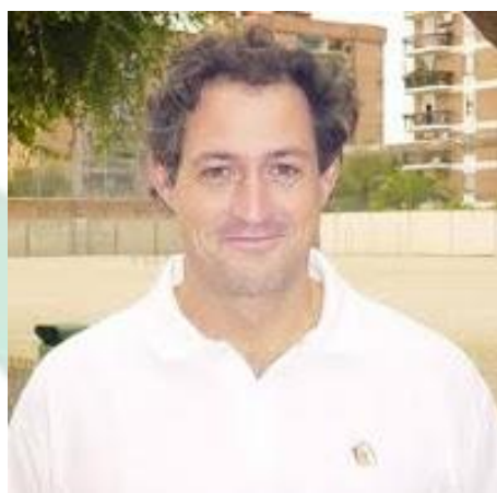
ANTONIO J. GONZALEZ AROCA HOSPITAL VIAMED EL REVERSO