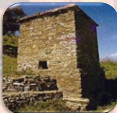
Columbario de la Torre del Monje