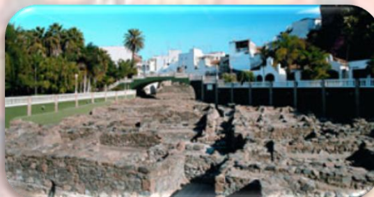
Factoría Salazón de Pescado "El Majuelo "