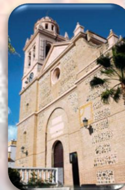
Iglesia Virgen de la Encarnación