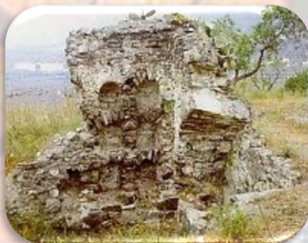
Columbario la Albina