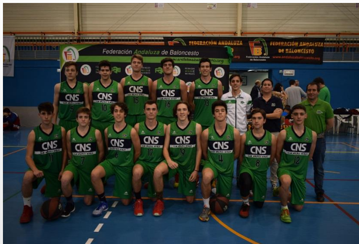
CLUB NÁUTICO SEVILLA