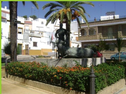
PLAZA DE JOSELITO EL GALLO