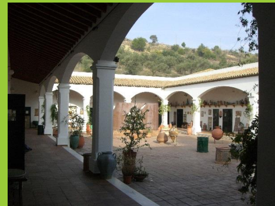
ESCUELA DE ARTESANOS