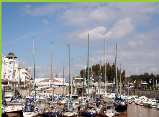
PUERTO DEPORTIVO DE GELVES