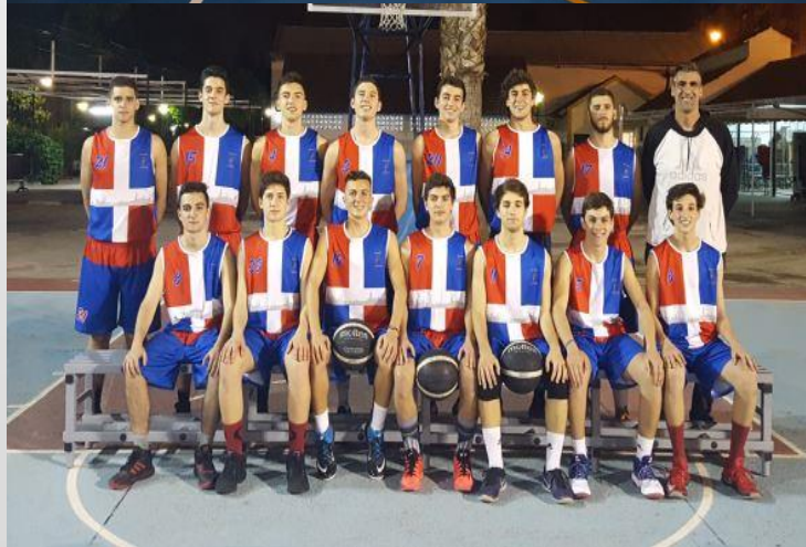
REAL CÍRCULO DE LABRADORES