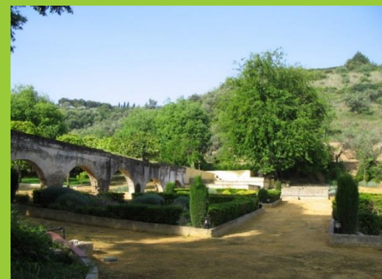
PARQUE DEL PANDERO