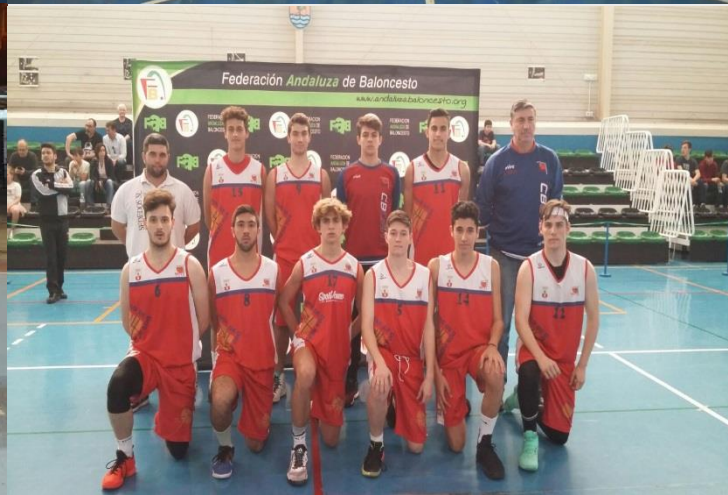
C.B. CIUDAD DE DOS HERMANAS