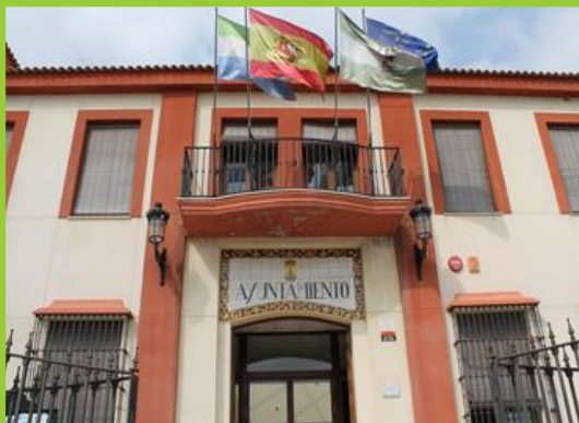
EXCMO. AYUNTAMIENTO GELVES