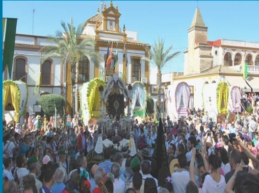
EL ROCIO EN GINES