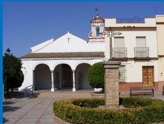
PLAZA DE SANTA ROSALIA