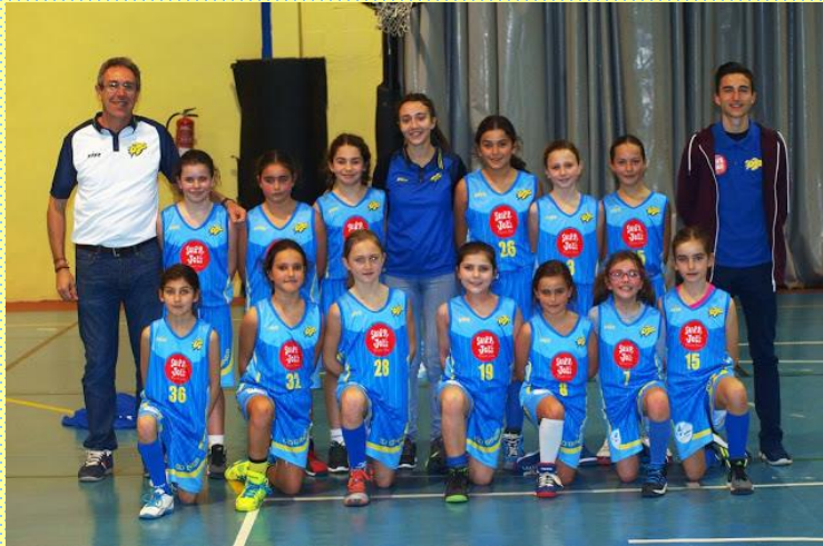
SLOPPY JOE'S CD GINES BALONCESTO