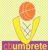
CLUB BALONCESTO UMBRETE