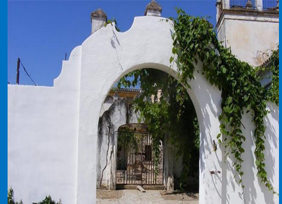
HACIENDA SANTO ANGEL