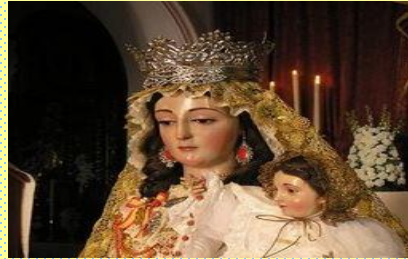
N a S a DE BELÉN