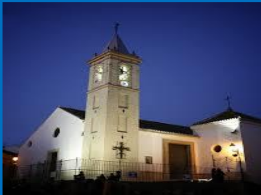
EXCMO. AYUNTAMIENTO DE GINES