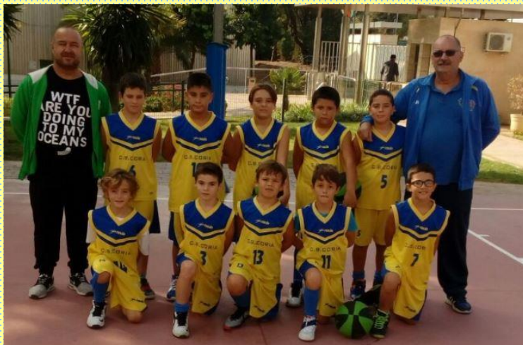
CLUB BALONCESTO CORIA