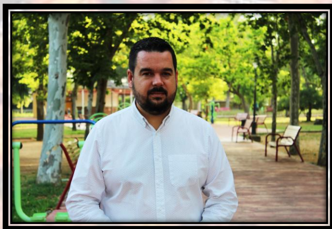
Romualdo Garrido Sánchez. Alcalde de Gines

Gines vuelve a convertirse en sede de un nuevo evento deportivo, una cita que en esta ocasión acogemos de manera conjunta con la vecina localidad de Bormujos. Del 16 al 21 de mayo ambos municipios celebramos por vez primera el Campeonato de Andalucía de Clubes Infantil Masculino, una cita ineludible para los amantes del baloncesto que nos situará durante unos días como centro de este deporte.